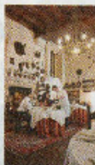
IL CASTELLO Sorge vicino a Montagnana Sopra: la sala del camino